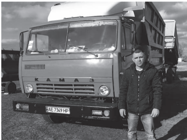
Біля КамАЗа фермер зазнав протизаконного збройного нападу межівських поліцейських.